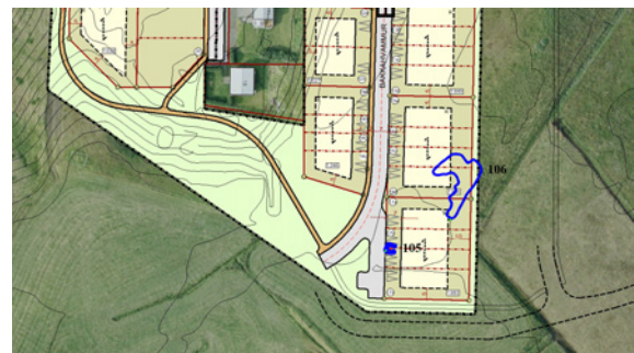
Mynd 3. Deiliskipulagsreitur við Borgarbraut í Búðardal, en hætt var við þenna reit. (Teikn. Efla, verkfræðistofa).