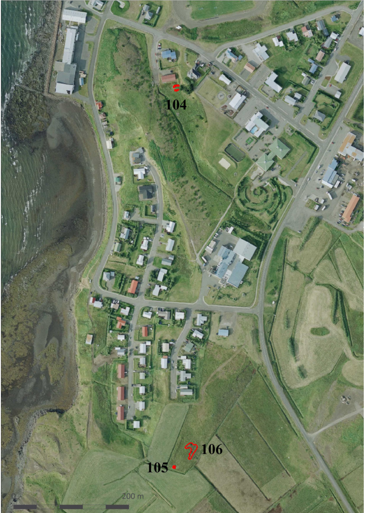
Mynd 4. Yfirlit yfir allar fornleifarnar/minjarnar sem fundust við vettvangskönnunina. Þær eru allar innan skipulagsreitanna. (Loftmynd Efla. Viðbætur Fornleifafræðistofan).