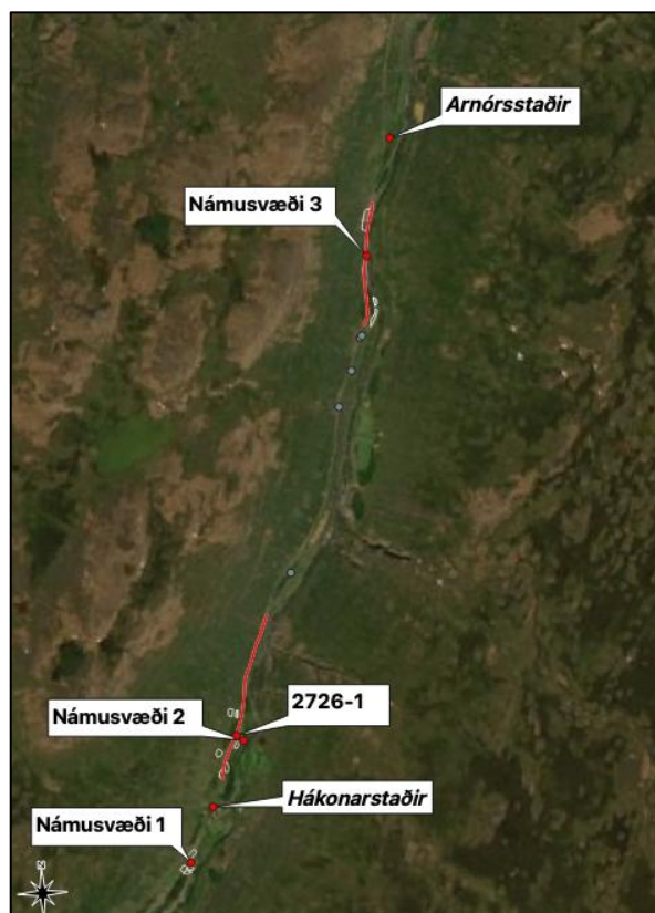
Mynd 6. Yfirlitsmynd yfir þær minjar sem fundust á framkvæmdasvæðinu (2726-1).