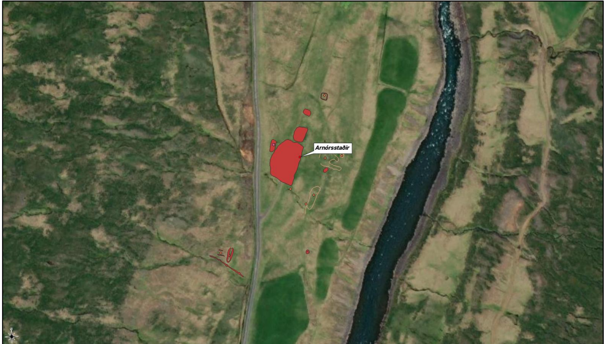
Mynd 3. Minjar að Arnórsstöðum sem mældar voru upp við fyrri fornleifaskráningu og reyndust utan framkvæmdasvæðisins.