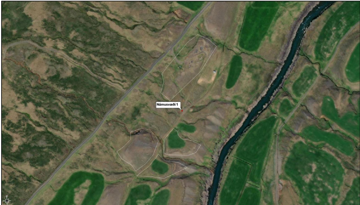
Mynd 2. Námusvæði 1 merkt inn með fjórum hvítum polygonum.

að Hákonarstöðum 2. Á hlaði gamla bæjarins er Brunnhúshóll og Brunnur þar sem nú liggur þjóðvegur. 3