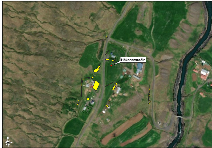
Mynd 2. Uppmældar fornleifar að Hákonarstöðum sem reyndust síðan vera utan framkvæmdasvæðisins.

Mældar voru upp yfir tuttugu fornleifar að Hákonarstöðum eftir úbendingum úbúenda að Hákonarstöðum 2 og 3 sem reyndust síðan vera utan framkvæmdasvæðis veglínunnar (sjá mynd 2). Því verður ekki gerð frekari grein fyrir þeim í þessari skýrslu.