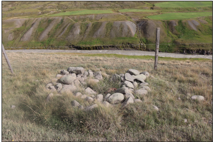
Mynd 4. Steinhleðsla 2726-1.

Steinhleðslan er 2,7 m breið og 2,5 m breið, steinhlaðin, breidd veggja um 1 m og inngangur til austurs, liggur A-V. Um þrjú umföru af steinum í hleðslu á hæð og breidd, hæð um 0,2-0,3 m. Í tóftinni liggur ryðgað járn, líklega hluti af búvél. Tóftin er stutt