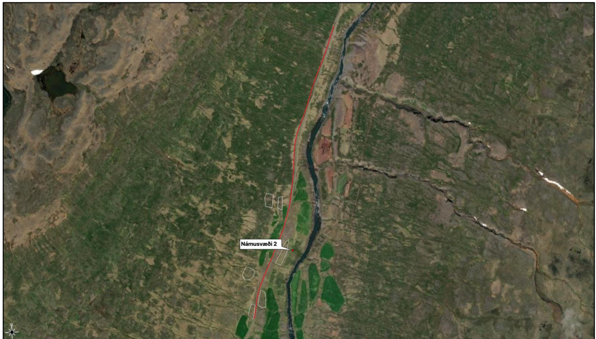
Mynd 3. Námusvæði 2 merkt inn með hvítu og veglína merkt inn með rauðu, sem breyta á norðan við Hákonarstaði.