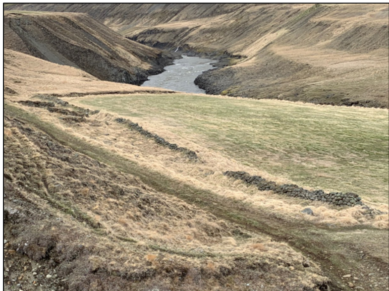
Mynd 3. Garður 2682-2.

2682-2. Garður eða aðhald. Í um 90 m fjarlægð sunnan við Jökulsá og um 450 m austan við örnefnið fornbylíð Stuðlafoss er grjóthlaðinn garður eða aðhald sem liggur A-V. Garðurinn er 83 m langur með frekar kringlóttum, mosagrónum steinum, í 7-8 laga hleðslu. Tvö hólf eða aðhöld, 10 m hvort að utanmáli