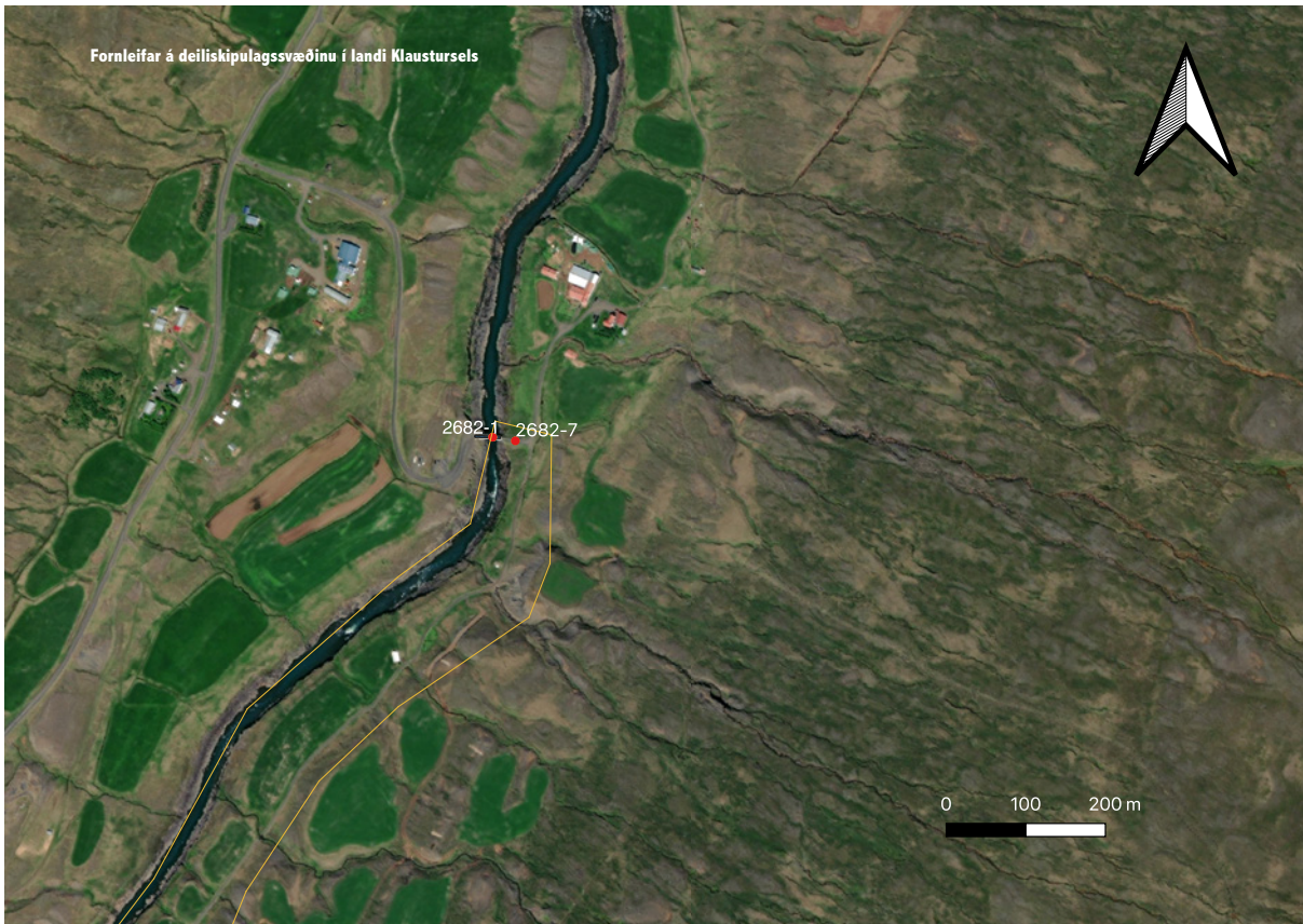
Mynd 9. Yfirlitsmynd 2 yfir minjar á deiliskipulagssvæðinu.