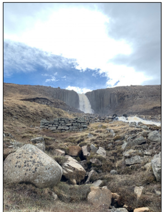
Mynd 5. Tóft 2682-4. Horft til suðurs.

2682-4. Myllutóft. Í um 40 m fjarlægð sunnan við réttirnar og í um 4 m fjarlægð austan við Fossá er steinhlaðin tóft með átta raða hleðslu. Tóftin er 5 x 4 m að utanmáli, liggur N-S og með inngangi til suðurs. Í hleðslunni eru flatir, mosagrónir steinar. Steinhlaðnir veggir tóftarinnar eru að hluta til holir að innan, sjá mynd 6. Í örnefnaskrá Stuðlafoss er