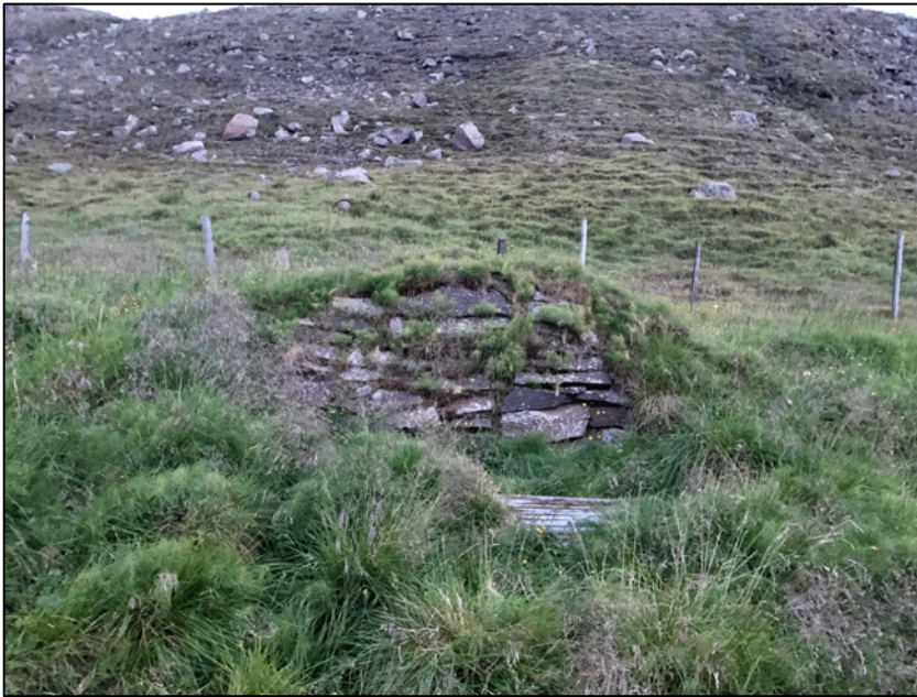
Mynd 7. Stafn af hesthúsi nr. 2682-8.

mældur upp að þessu sinni en hnitsettur upp við brúna þar sem hann er innan deiliskipulagssvæðisins.