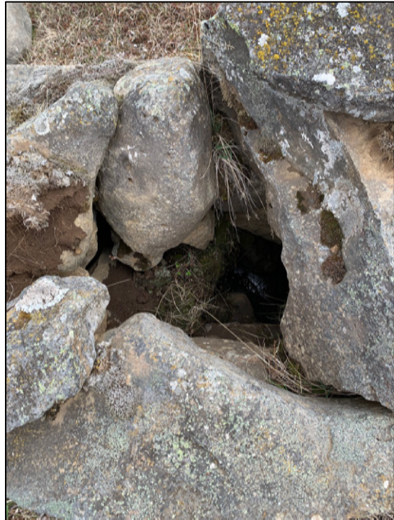
Mynd 6. Holrými innan í hleðslu 2682-4.