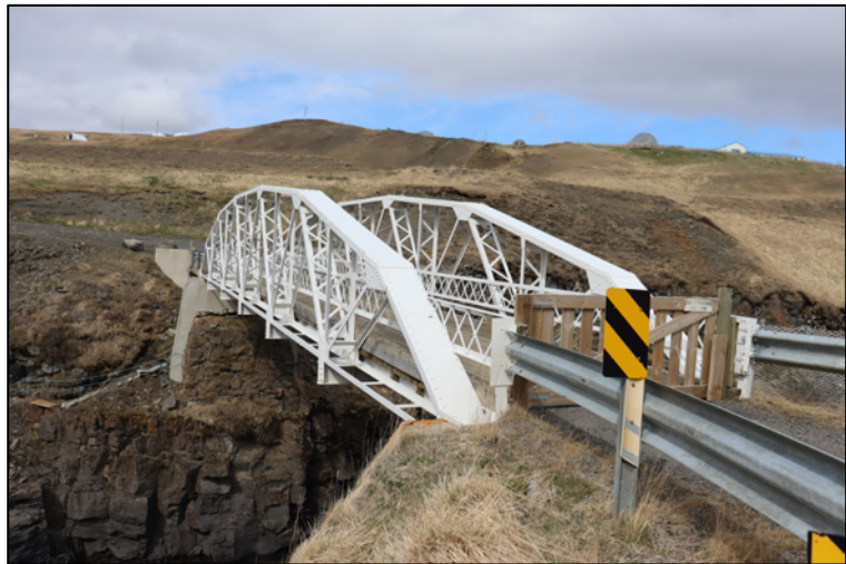
Mynd 2. Brú 2681-1. Horft til N.

Brúin þverar Jöklu á milli bæjanna Hákonarstaða og Klaustursels, á Klausturselsvegi sem liggur frá Jökuldalsvegi (vegur 923). Í skýrslunni Vegminjar, Norð og Norðausturland sem unnin var fyrir Vegagerðina árið 2019 segir að brúin sé skilgreind sem minjabrú. Jökulsá á Brú var í gegnum aldirnar talinn mikill