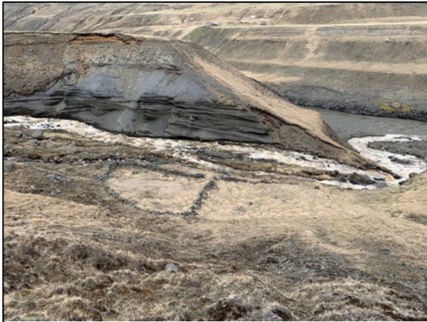
Mynd 4. Réttin hjá Stuðlafossi. Horft til NV.

eru sunnan við garðinn. Garðurinn er rofinn að hluta. Einnig virðist hafa verið torfhleðsla, nú rofin, ofan á steinhleðslunni. Fjallað er lítillega um garðinn í skýrslu Bjarna F. Einarssonar frá 2013. 6 Tóftin var mæld upp og ljósmynduð.