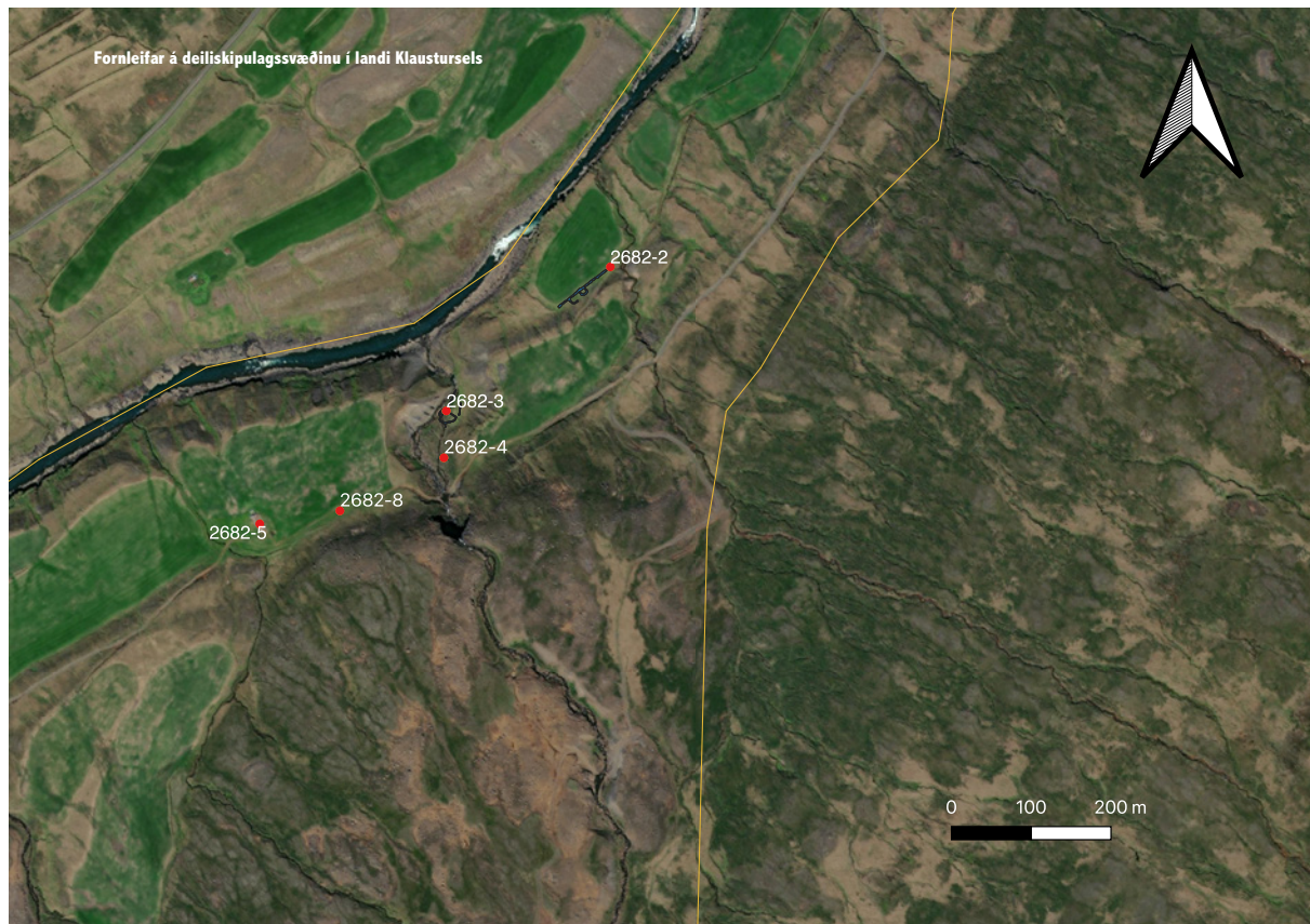
Mynd 8. Yfirlitsmynd 1 yfir minjar á deiliskipulagssvæðinu.

teiknað og ljósmyndað og gjóskulaga leitað til að aldursgreina eftir atvikum. Leita þarf leyfis Minjastofnunar Íslands í öllum tilfellum og stofnunin ákveður umfangið og setur þá skilmála sem henni kann að þykja nauðsynleg. Varast ber að nýta svæðin í kringum fornleifar sem geymslustaði eða brautir fyrir vélar og tæki, eða efnisgeymslur af hverju tagi nema að leyfi Minjastofnunar Íslands komi til með eða án skilmála sem stofnunin kann að setja.