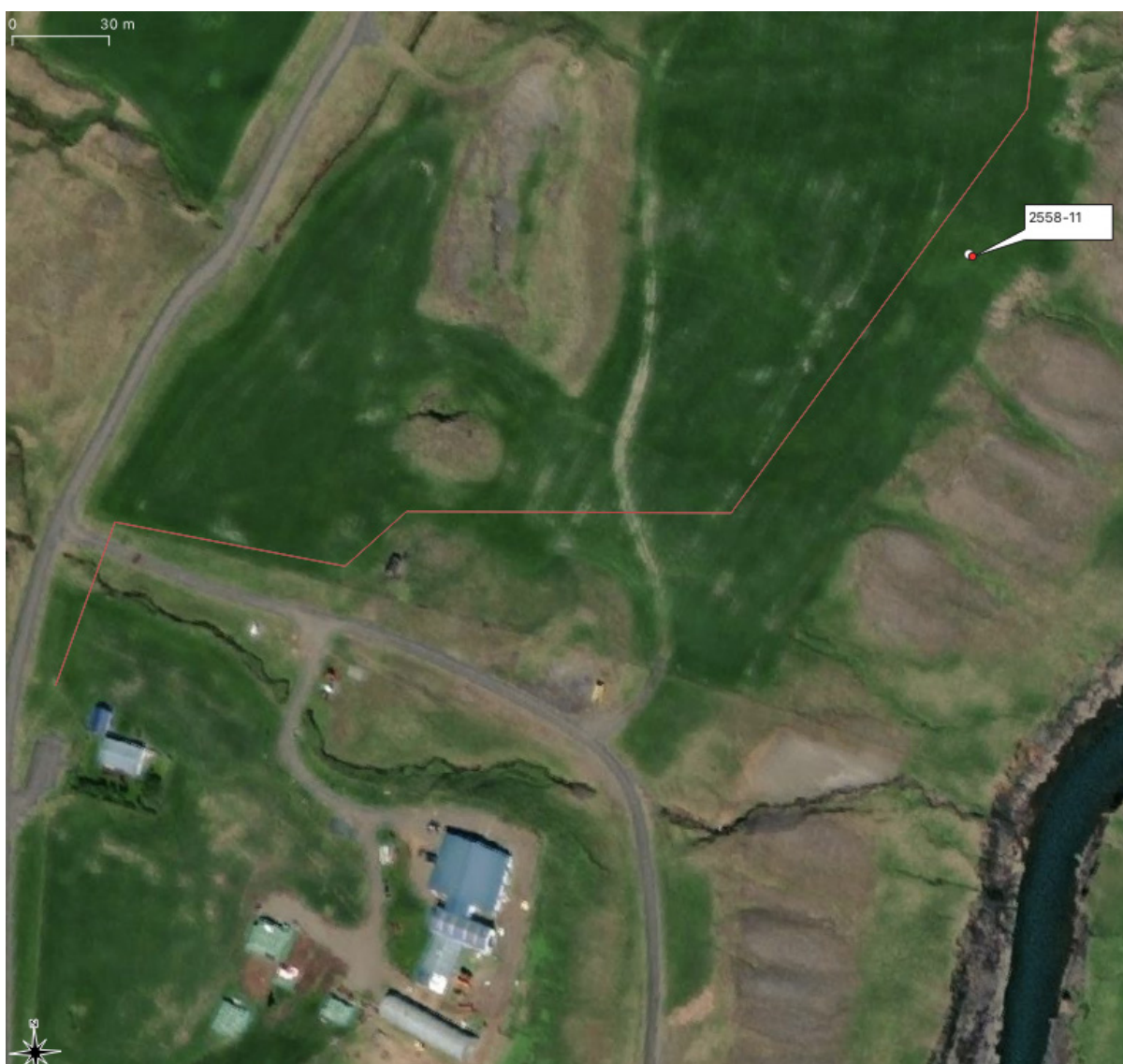
Mynd 2. Staðsetning minja 2558-11, heimildar um rétt, austan við Hákonarstaði 3.