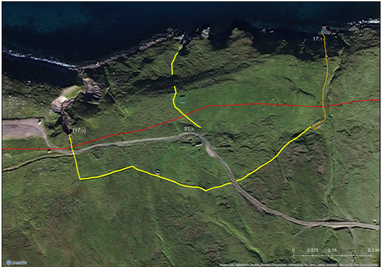
Mind 3. Staðsetningar fornleifa við Þórarinsstaði. Rauð lína er línuleiðin. Gular línur sýna óskráða garða. Annarsvegar allan túngarðinn utan um býlið og hins vegar garð í túninu neðan við bæinn, en ofar á myndinni. Þeir sáu ekki við vettvangskönnun þar sem þeir liggja yfir túnin. Rústin hægra megin við nr. 21 er steypt hús og rústin sunnan vegarins var ekki skráð þar sem hún er handan vegarins þar sem engin hætta er á ferðum.

framkvæmdir sem taka tillit til fornleifa (1. kostur), nákvæmari GPS staðsetningu og ljósmyndun að nákvæmri fornleifarannsókn. Rannsóknir á einfaldari fornleifum eins og görðum og vegum er gjarnan þverskurður í gegnum þær, hann teiknaður í sniði, ljósmyndaður og gjóskulaga leitað til að aldursgreina eftir atvikum. Rannsóknir á yngri skepnuhúsum geta einskorðast við þverskurði í leit að eldri minjum undir, eða að ákveðinn hluti húsa séu fullransakaðir, ef allt húsið er ekki fullransakað. Leita þarf leyfis Minjastofnunar Íslands í öllum tilfellum og stofnunin ákveður umfangið og setur þá skilmála sem henni kann að þykja nauðsynlegir.