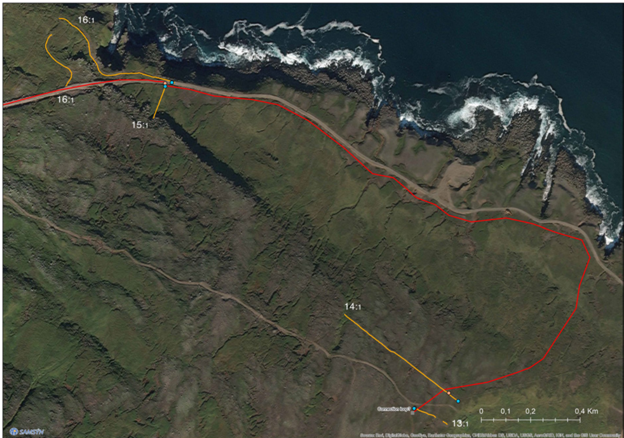
Mynd 4. Staðsetning fornleifa í nágrenni Austdals. Norður vísar upp.

fylgir 15 m friðhelgunarsvæði út frá ystu mörkum þeirra. Sjá nánar meðfylgjandi fornleifaskrá.