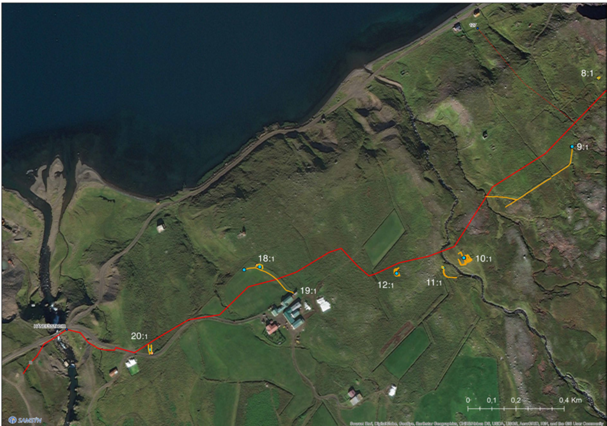
Mynd 2. Staðsetning fornleifa í nágrenni Háfellsstaða. Rauð lína er línuleiðin. Norður vísar upp. (Loftmynd: Esri, DigitalGlobe. Viðbætur Samsýn/Fornleifafræðistofan).

Sex staðir töldust hafa talsvert minja- og varðveislugildi og átta höfðu lítið minja- og varðveislugildi. Einn þeirra síðasttöldu eru taldir yngri en 1900. Það eru meint rúst (nr. 12) sem talin er vera frá 20. öld.